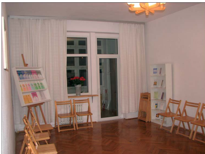
Centrum Lectorium Rosicrucianum w Wrocławiu