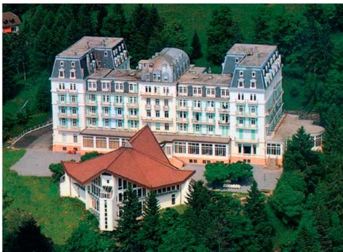
Ośrodek konferencyjny Lectorium Rosicrucianum w Caux (Szwajcaria)