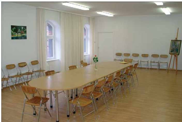
Centrum Lectorium Rosicrucianum w Warszawie