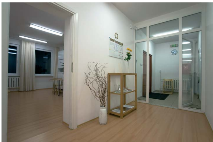
Centrum Lectorium Rosicrucianum w Koszalinie