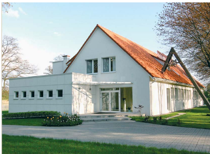
Ośrodek konferencyjny Lectorium Rosicrucianum w Wieluniu