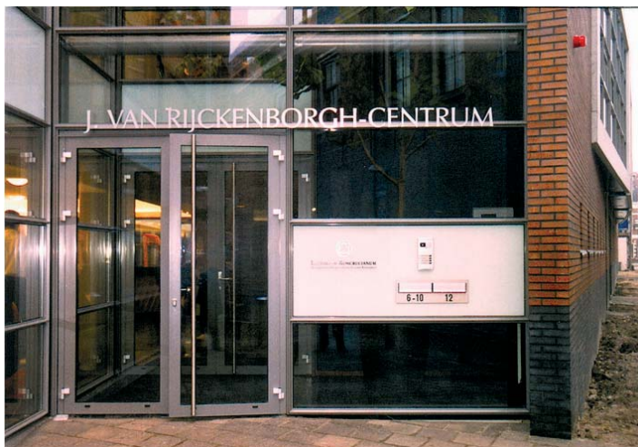
Centrum Lectorium Rosicrucianum w Haarlem (Holandia) Siedziba Główna Międzynarodowej Szkoły Złotego Różokrzyża