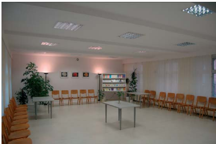
Centrum Lectorium Rosicrucianum w Katowicach