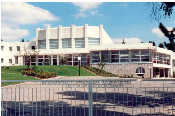
Ośrodek konferencyjny Lectorium Rosicrucianum w Bad Münstereifel (Niemcy)